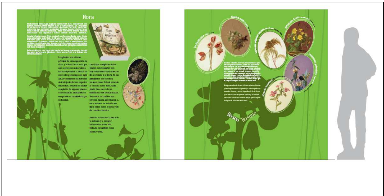
Dossier de la exposición "Loreak asmatzen: Naturalistas europeos en el País Vasco, 1810. Petit de Meurville - Pietro Bubani". 2010